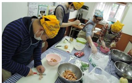
『作って食べよう!』 ピザ作り