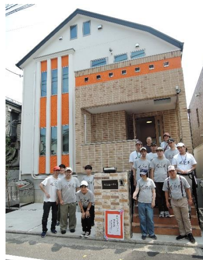
FC目黒の利用者も内覧会へ

利用者の方々は、日中は福祉的就労として作業をする事業所へ通い、夕方にホームへ帰ります。土日、祝日等は自宅へ帰る方もいれば、ホームを自宅として生活している方もいます。障害のある方が暮らすグループホームは、生活していく施設でありながら地域の中で住宅として存在しています。町内会にも加入させていただき地域の一員になっていけるよう利用者、支援者共々心がけていきますので、どうぞよろしくお願いいたします。