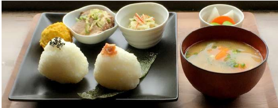
日替わりおむすびプレート (限定15食) ¥1000 主菜なしの場合 ¥800