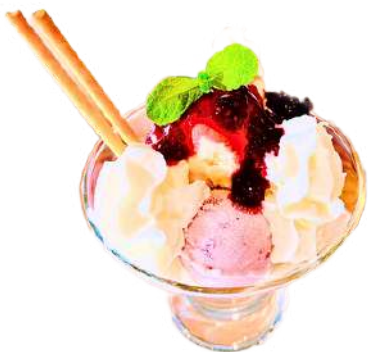
ベリーベリーパフェ ¥600