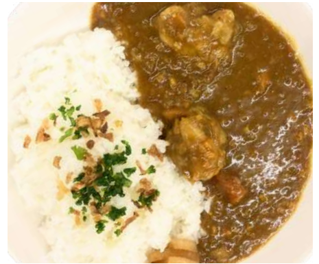
野菜たっぷりチキンカレー ¥850 大盛り +¥100