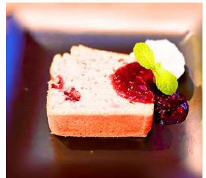
いちごのパウンドケーキ ¥350